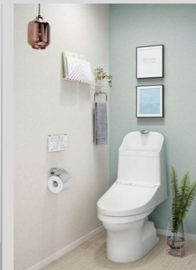
ZJ シャワートイレ (住実)