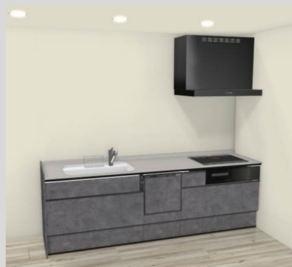
ES I型キッチン 間口2550 (LIXIL)