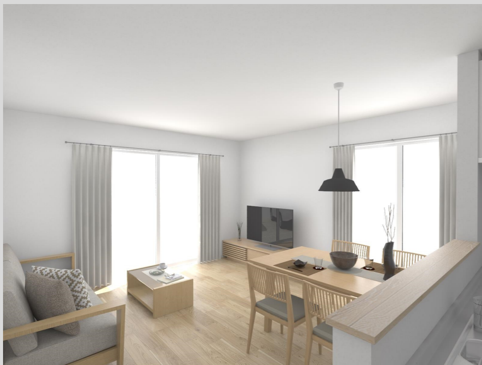
リビングイメージ