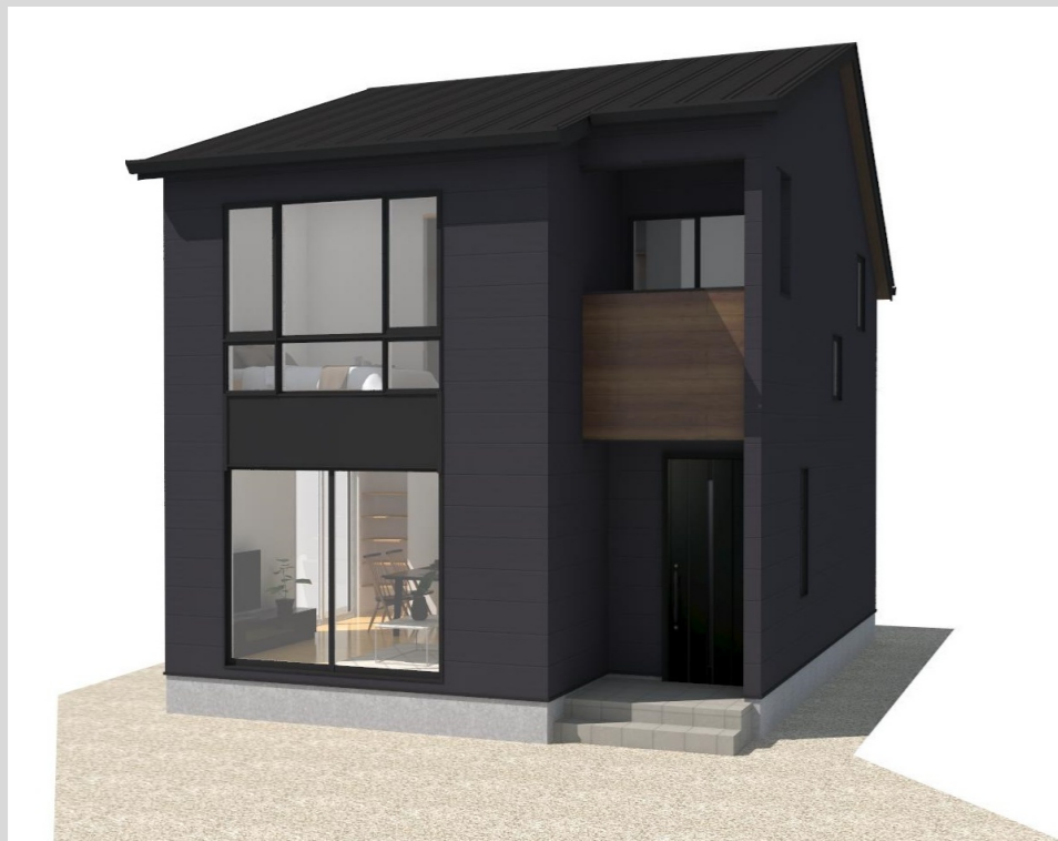
南東側外観イメージ