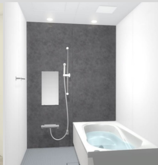
AX 1616サンス (LIXIL)